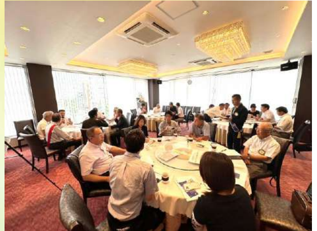
<会場となる淵野辺公園の様子>