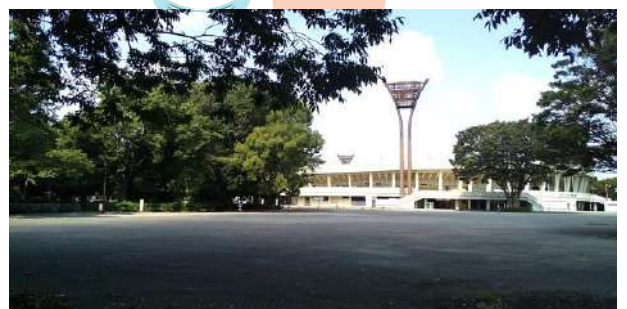
(臨時駐車場やブースエリアとなる場所)