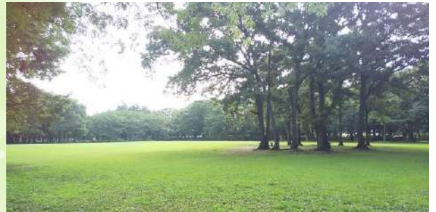
(淵野辺公園の芝生広場)