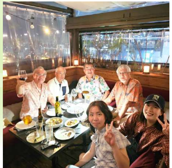
各テーブルに分かれて食事を堪能