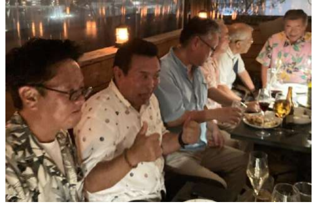
♡「ビアパーティのお料理」♡